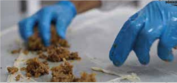
Lezzet katılarak börekler üretilir.