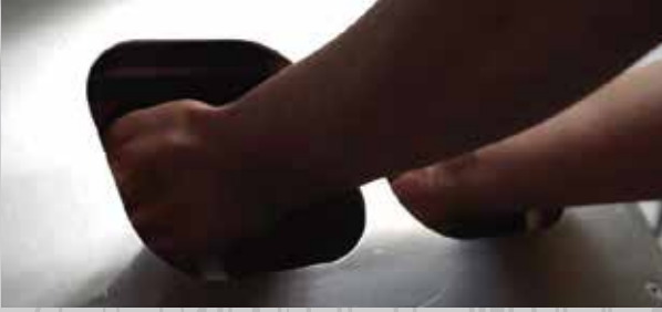
Ellere sabun alınmadan bariyer açılmaz.