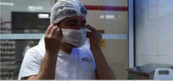
Üretime her girişte tek kullanımlık maske ve boneler giyilir.