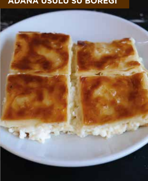
ADANA USULÜ SU BÖREĞİ