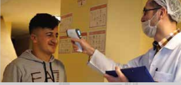
Üretim öncesi personelin vücut ısıları ölçülür.