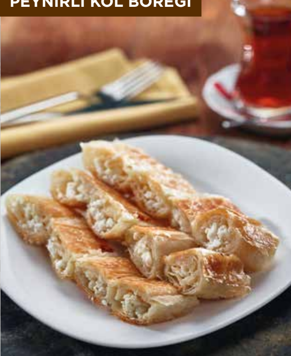
PEYNİRLİ KOL BÖREĞİ