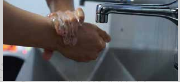
Eller sıcak su ile yıkanır ve tek kullanımlık havlu ile kurulanır.