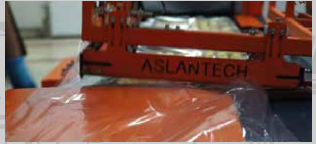
Hijyenik ambalajlarla sevkiyata hazırlanır.