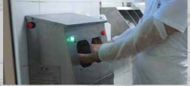
Eller son defa dezenfekte edilerek üretime geçilir.