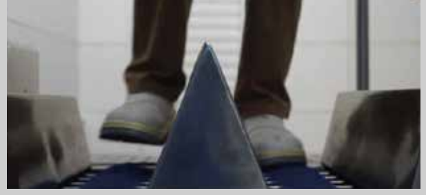
Hijyen bariyerinde ayaklar temizlenir.