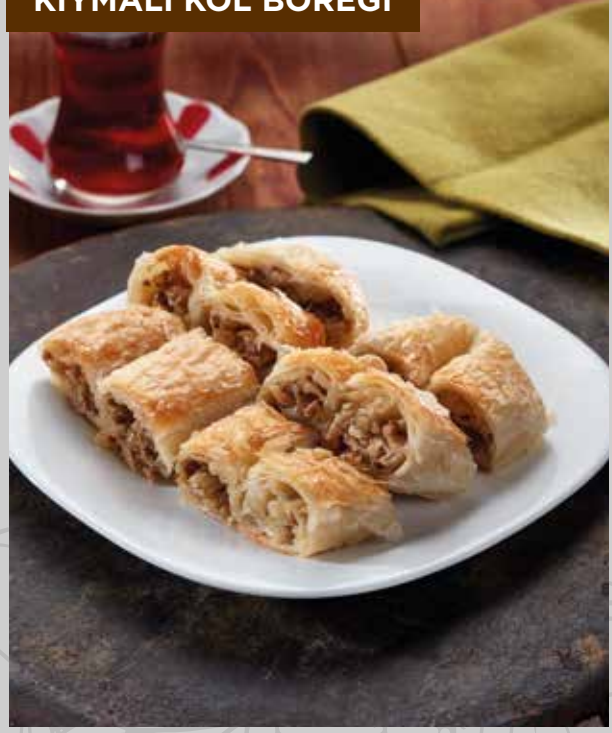
KIYMALI KOL BÖREĞİ